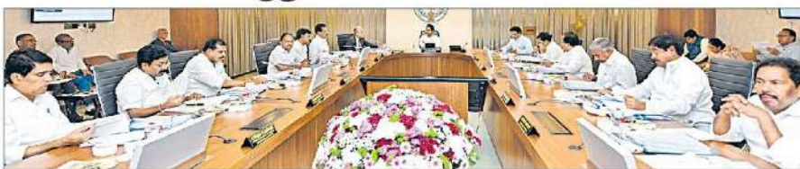
మంత్రిమండలి సమావేశంలో ముఖ్యమంత్రి సీఎం జగన్ మోహన్ రెడ్డి